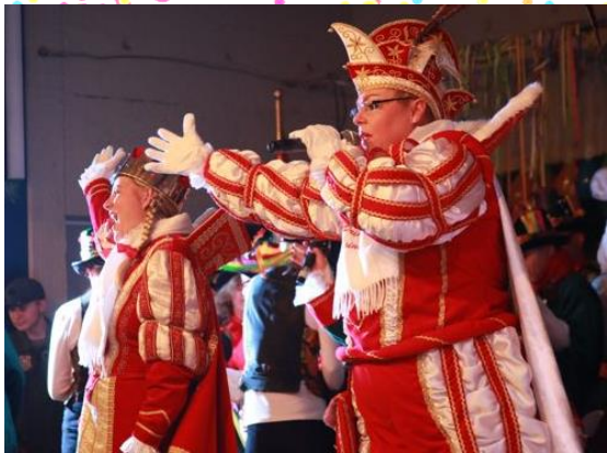
voll geschmückte Aula.

hieß es auch an Weiberfastnacht an der JGR. Den Auftakt des Festaktes lieferte das Bensberger Dreigestirn mit einer Tanz- und Gesangseinlage. Nicht weniger unterhaltsam ging es weiter mit rhythmischen Tanzeinlagen der Schülerinnen und Schüler, gefolgt von stimmungsvollen Polonaisen durch die prunk-